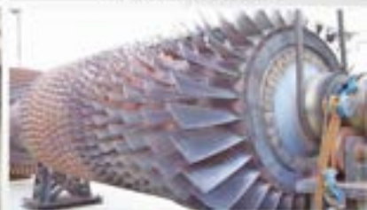
Rotor Blade Rust Removal