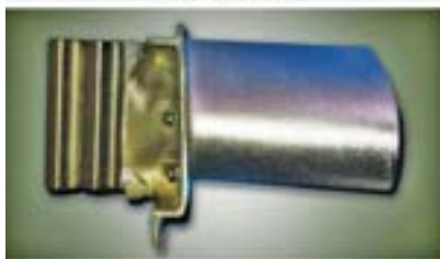
Casting Paint Removal