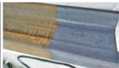
Railway track derusting