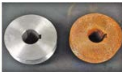
Part Rust Removal